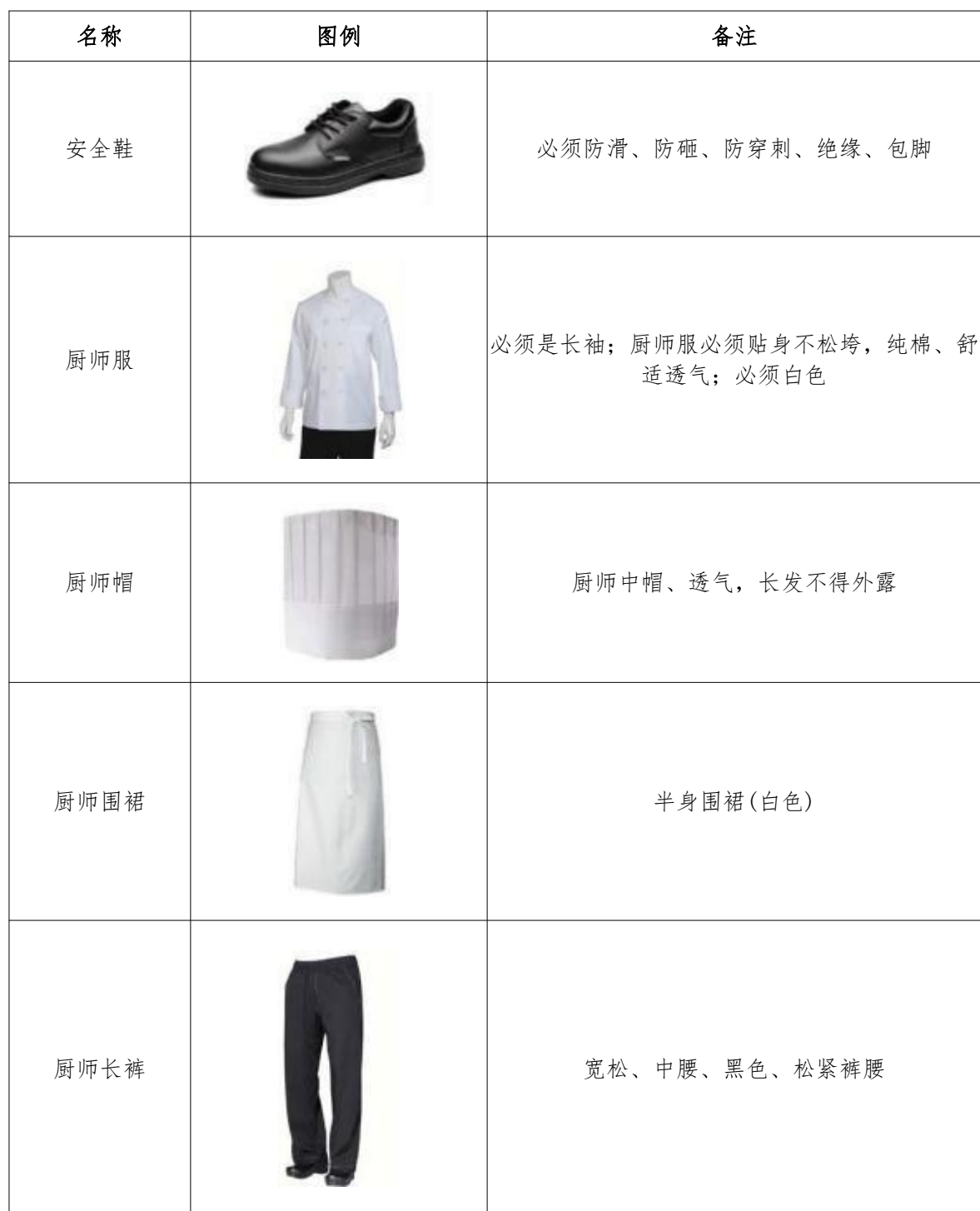
附件3 选手工装规范